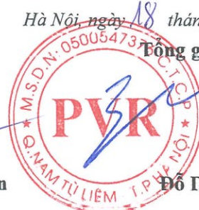
Đỗ Duy Điền